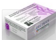
Тест-системы ИммуноКомб для диагностики Хеликобактериоза

В Российской Федерации ИФА БПТ ИммуноКомб разрешены и успешно используется для скрининга и обследования доноров с 1992 года.