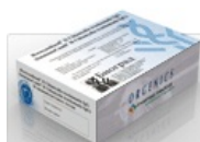
Тест-системы ИммуноКомб для диагностики ВИЧ-инфекции