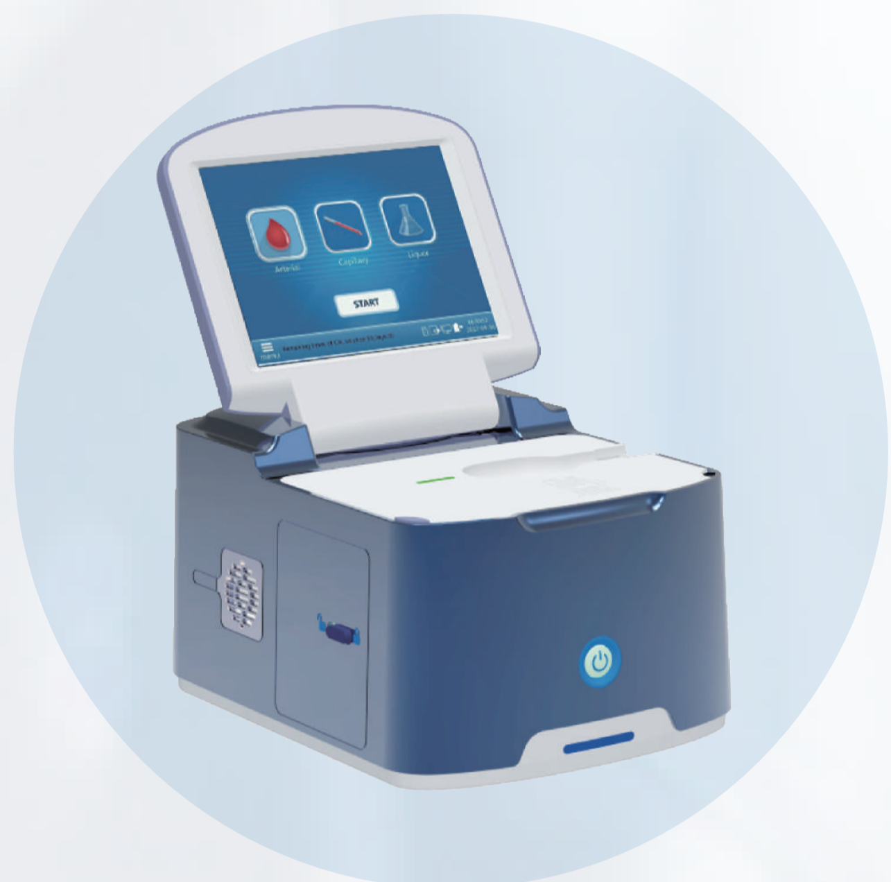
Анализ газов крови