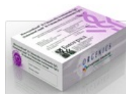
Тест-системы ИммуноКомб для диагностики Хеликобактериоза