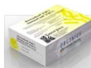
Тест-системы ИммуноКомб для диагностики Гепатитов А, В и С