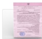
Новые медицинские технологии диагностики TORCH-комплекса