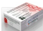
Тест-системы ИммуноКомб для диагностики TORCH-комплекса